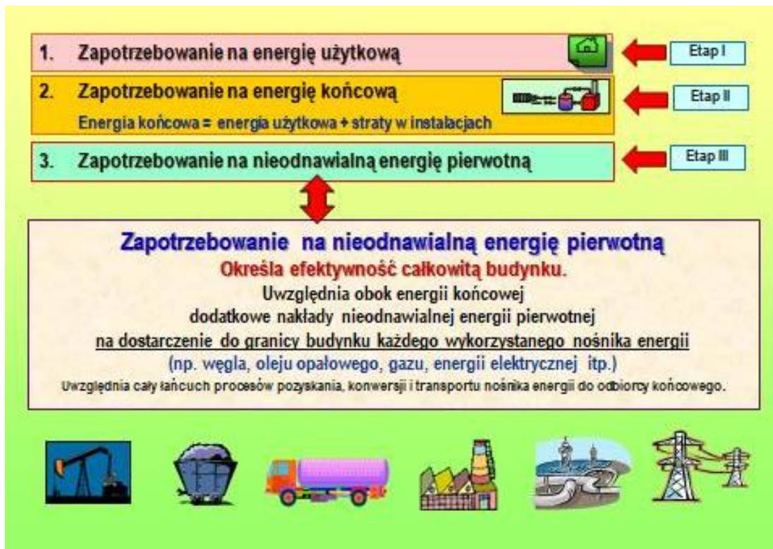
Rys. 2 Podstawowe etapy określania charakterystyki energetycznej